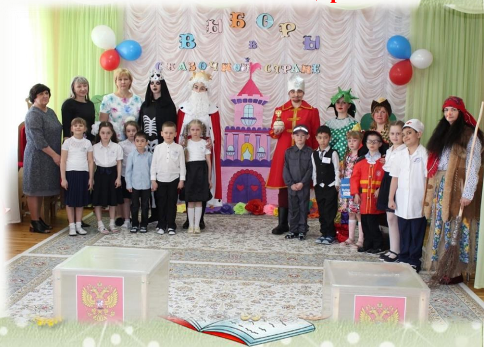
Выборы в сказочной стране 2021г. Роль царя.