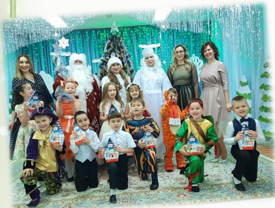
Новогодний утренник в подготовительной группе 2021-2022г. Роль ведущего

А.С.Макаренко писал: «Не может быть хорошим воспитатель, который не владеет мимикой, не может придать своему лицу необходимое выражение. Убеждён что в будущем в педагогических вузах обязательно будет преподаваться и постановка голоса, и поза, и владение своим организмом, и своим лицом», поэтому с удовольствием примеряю на себя разные роли!