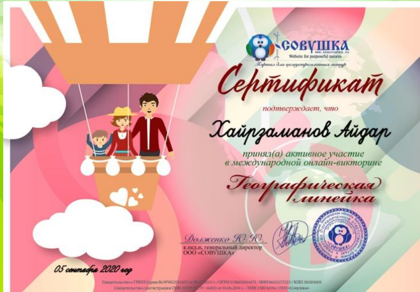
Сертификат об участии в международной онлайн – викторине «Географическая линейка»