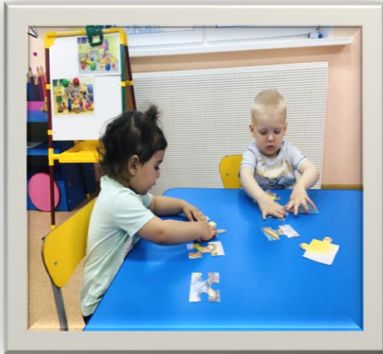
Д/и «Собери пазл»