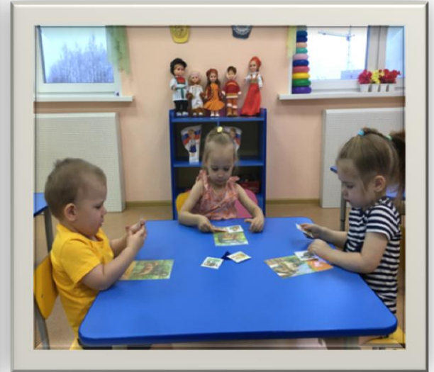
Д/и «У кого какая мама»