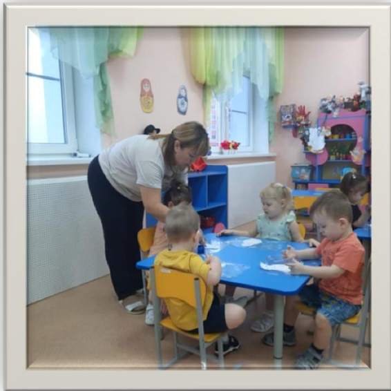
Пальчиковая игра «Сорока – белобока»