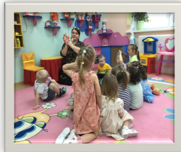
Пальчиковая игра «Моя семья»