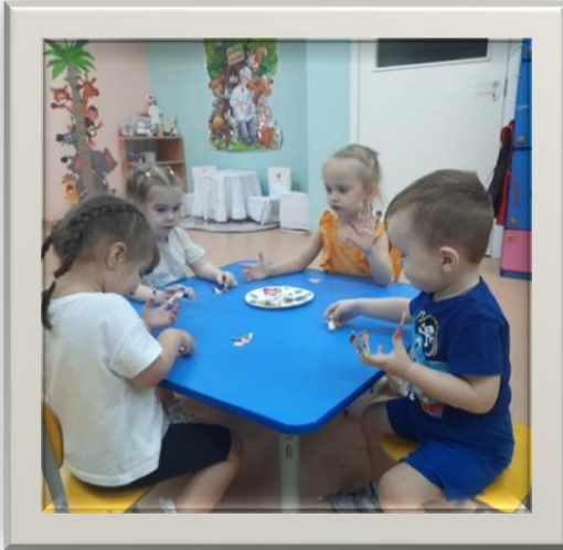
«Рассматривание семейных альбомов»