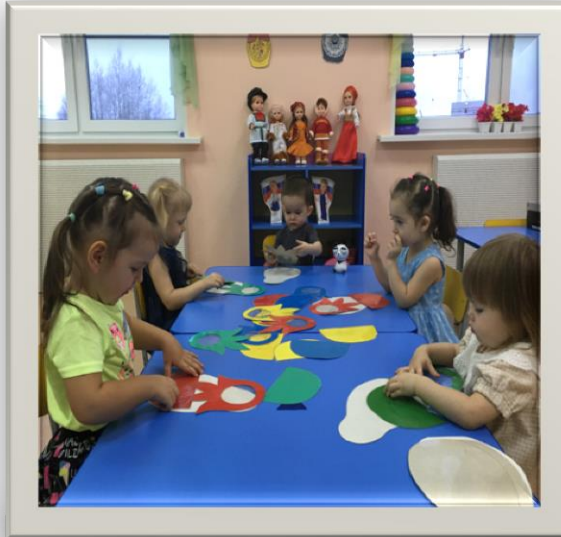
Д/и «Наряди матрешку»