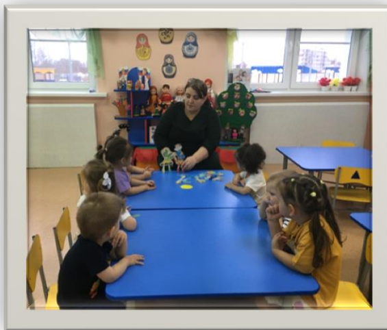
Показ настольного театра «Репка»