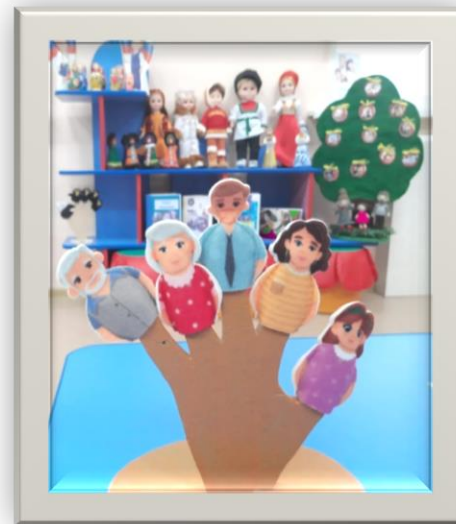
Пальчиковая игра «Моя семья»