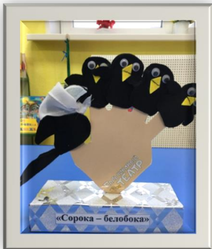
«Сорока – белобока»