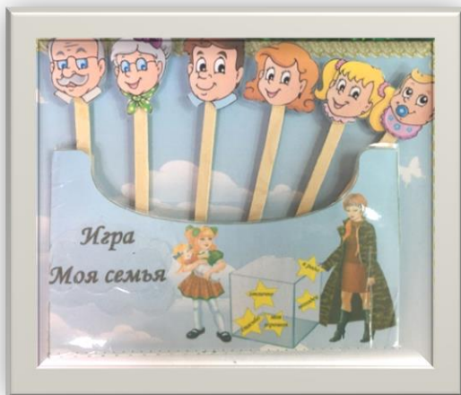
Театр на палочках «Моя семья»