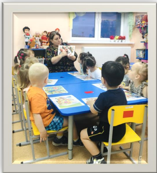
«Рассматривание картины «Моя семья»